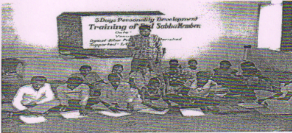
बाल संसद प्रशिक्षण