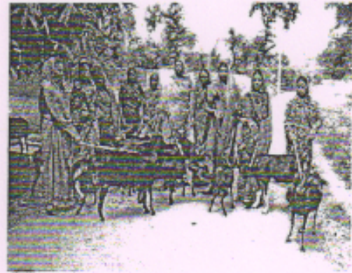
समूह का बैठक एवं आजीविका हेतू बकरी पालन